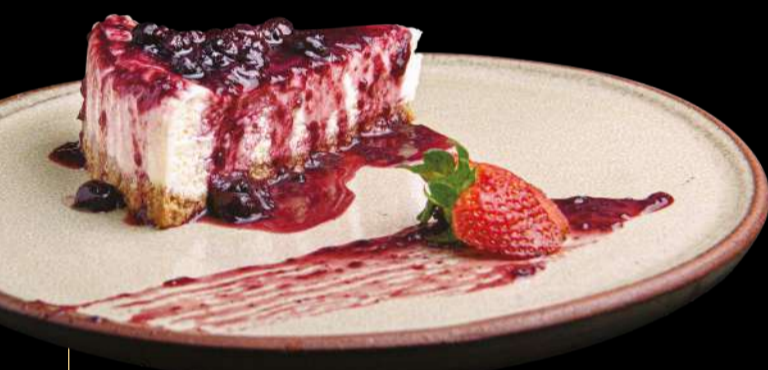
CHEESECAKE COM CALDA DE FRUTAS VERMELHAS