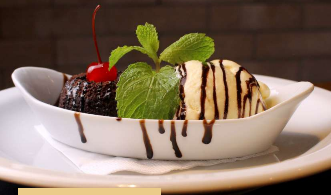
PETIT GÂTEAU COM SORVETE DE CREME